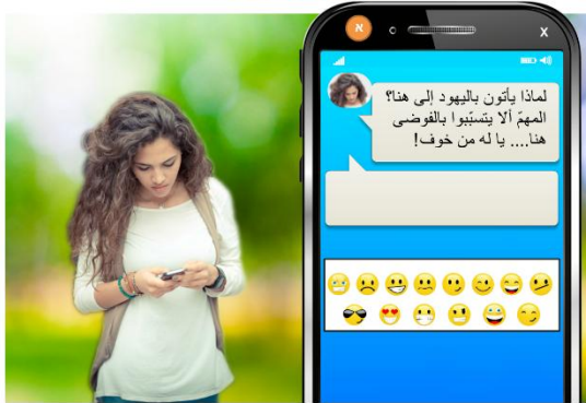
تكتب سهى إلى صديقتها: